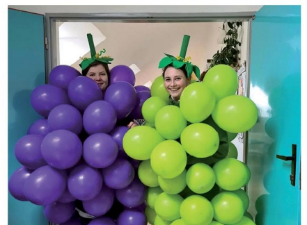
Poslední zvonení je pro maturanty tradiční příležitostí, jak se vtipně a s humorem rozloučit se školou.