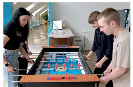
Ve volném čase si lze zahrát přímo ve škole také stolní fotbal.