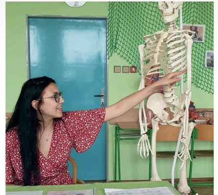
Takhle to vypadá při maturitní zkoušce.