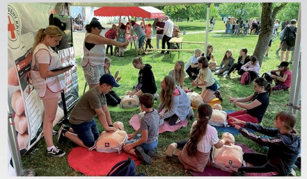
Při Dnu dobrovolnictví v Klášterních zahradách ukazovaly zásady první pomoci také studentky chrudimské zdravotní sestra.