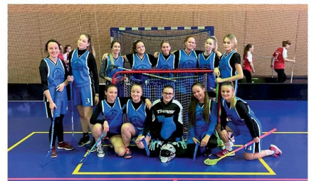
Mezi nejoblíbenější sporty ve škole patří zejména florbal – ostatně družstvo dívek skončilo v okrese Chrudim na druhém místě.