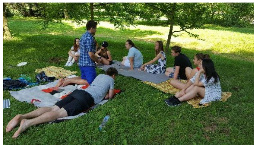
preventivní program „Prsa, koule“