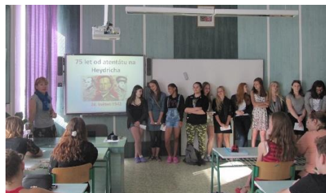
program o atentátu na R. Heydricha