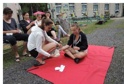
sportovně zdravotnický kurz 3. roč.