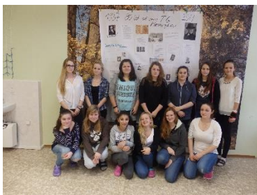
Program o TGM