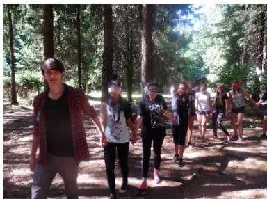
Adaptační kurz 1. roč.