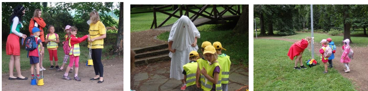
Pohádkový park pro MŠ Dr. Malíka a MŠ Na Valech

3 setkání žáků školy s dětmi v MŠ Dr. Malíka a MŠ Na Valech (celo dopolední program pro děti 19. – 20. 12 2016, 24. 4. 2017, Pohádkový park 29. 6. 2017)