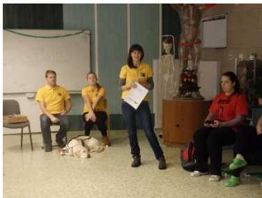
Zážitkový seminář – TyfloCentrum