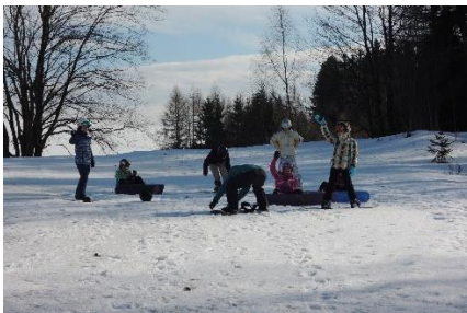
zimní kurz 2. roč.